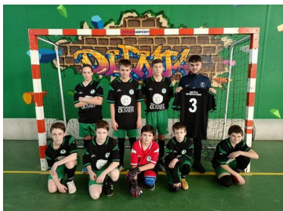
L'équipe U15 a reçu de nouveaux maillots

Plus d'informations par mail : futsal.barnabeen@gmail.com ou par téléphone au 06.67.72.08.48.